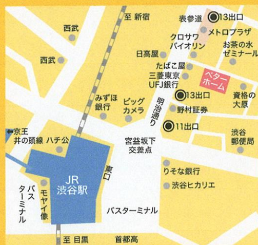
JR、銀座線渋谷駅より徒歩4分 東横線、副都心線、半蔵門線渋谷駅より徒歩3分 (13出口または13a出口からは徒歩1分!)